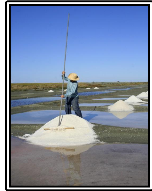
Marais salant Les Blanches

Visite et vente directe tous les jours en Juillet et Août