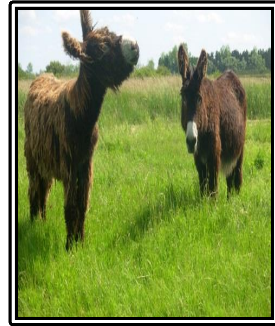
La Maison de l'Âne