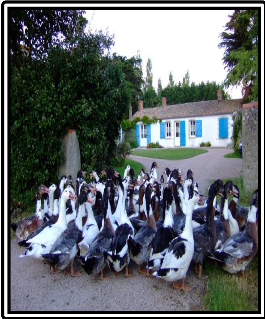
La Ferme du Pas de l'île