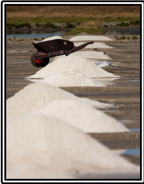
Marais salant de la Pétillière